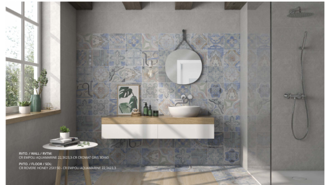
R.VTO. / WALL / R.VTM. CR EMPOLI AQUAMARINE 22,3x23,3 - CR CROMAT GRIS 30x60 P.VTO. / FLOOR / SOLI CR ROVERE HONEY 25x150 - CR EMPOLI AQUAMARINE 22,3x23,3