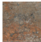
Cr. Senesi Copper 22,3x22,3 M19 15.826.287/9792