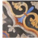
Cr. Empoli Earth 22,3x22,3 M19 15.826.469/9793