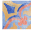
Cr. Empoli Skyblue 22,3x22,3 M19 15.826.379.9793