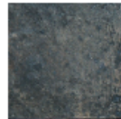
Cr. Senesi Ferro 22,3x22,3 M19 15.826.508.9792