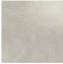
AUSTIN TAUPE 58X58 - 22,8"X22,8"