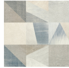
AUSTIN DECOR MIX 58X58 - 22,8"X22,8"