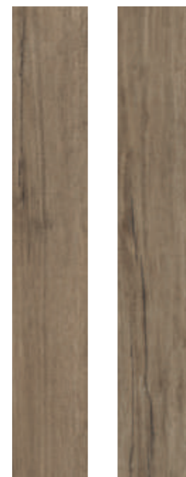
Nut 19,7x120 RT 7 3/4"x48" Nut 19,7x120 RT strutturato 7 3/4"x48"

* 14,7x120RT 5 3/4"x48 disponibile su ordinazione . available only upon request