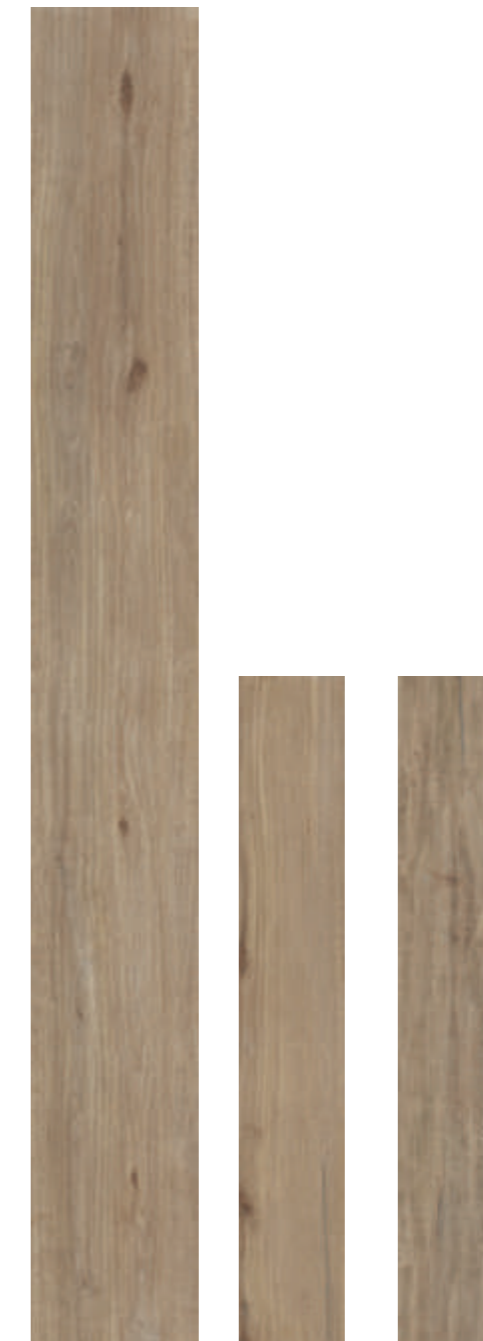
Gold 30x240 RT 12"x96" Gold 19,7x120 RT 7 3/4"x48" Gold 19,7x120 RT strutturato 7 3/4"x48"

* 14,7x120RT 5 3/4"x48 disponibile su ordinazione . available only upon request