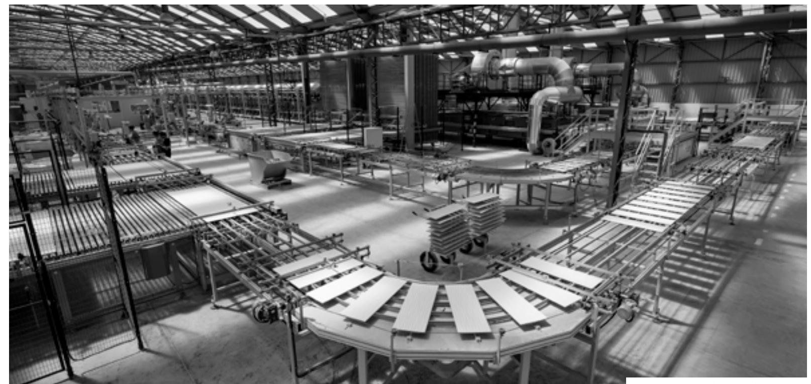
FACTORY 2 Onda (Castellón)