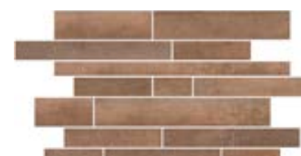
SHANON MURETTO OXIDE (MLLA)