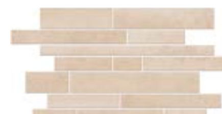
SHANON MURETTO CREAM (MLLA)