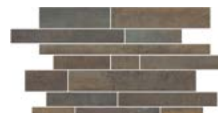
SHANON MURETTO GRAPHITE (MLLA)