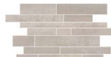
SHANON MURETTO GREY (MLLA)